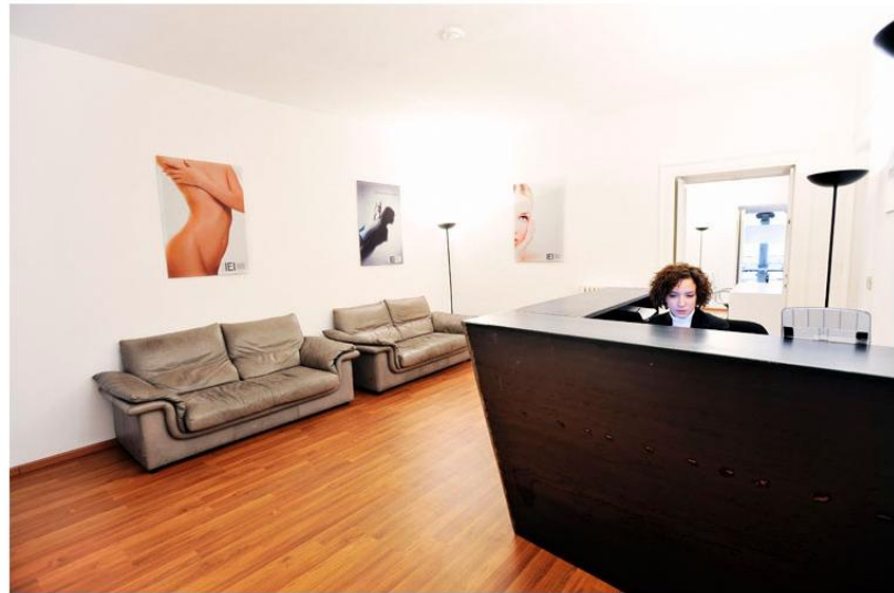
Interno - Hall Image 8 of 10