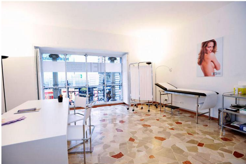
Interno - Studio visite Image 7 of 10