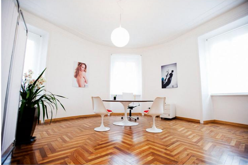
Interno - Studio visite chirurgia estetica Roma Image 1 of 10